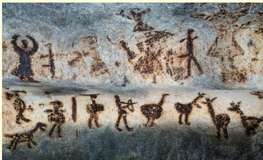
Jaskinia Magura z prehistorycznymi malowidłami