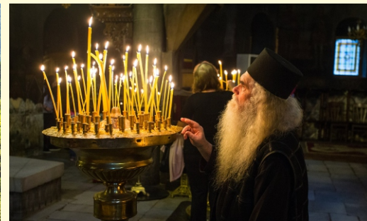
monastyr Baczkowski Nocleg w zabytkowym pensjonacie w wiosce Kosovo