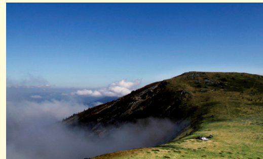
Nocleg pod górą Kom