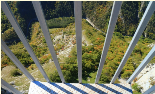
Wjazd lokalnymi 4x4 na punkt widokowy w Jagodinie