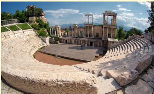
stare miasto w Płowdiw