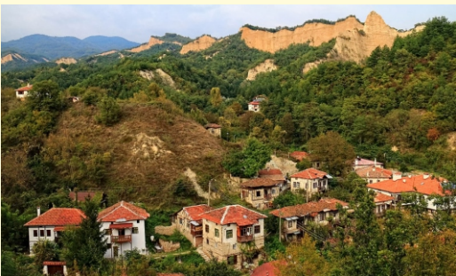
Melnik i Skały Melnickie