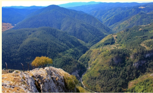
Rodopy c.d. - wzdłuż granicy z Grecją