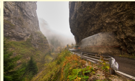
Wąwóz Trigradzki Nocleg w górach