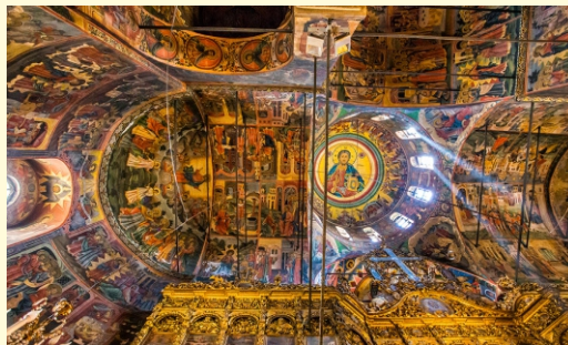
do wyboru monaster Rożeński lub Rilski