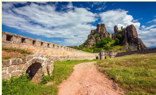
Belogradzkyk - skały i twierdza