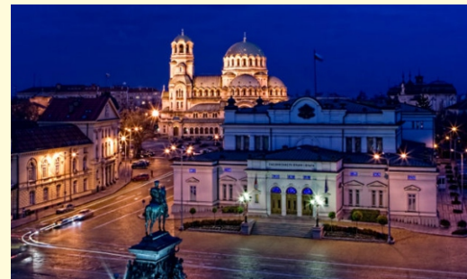
Nocleg w terenie lub w hotelu w Sofii