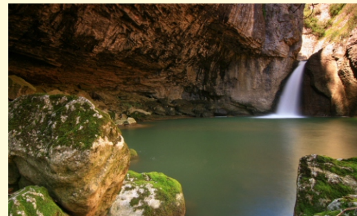
Kanion Emski Nocleg w zabytkowym pensjonacie w Bozhenici