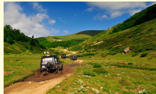
Stara Płanina Nocleg w górach