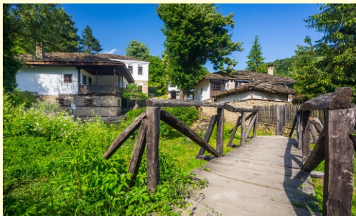
Rezerwat etnograficzny Bozhenici