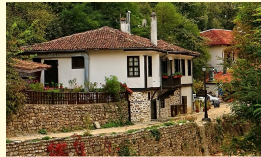
Nocleg w pensjonacie w Melniku - stolicy bułgarskiego wina